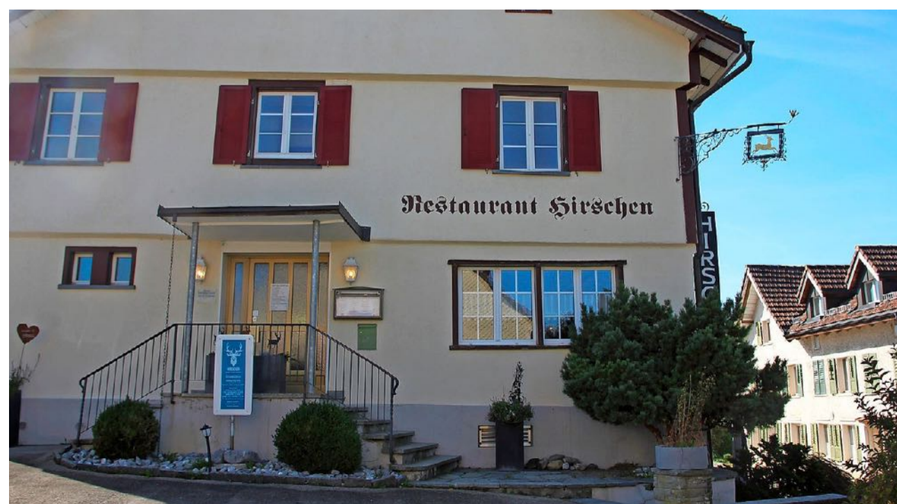
Lernen Sie das Restaurant Hirschen kennen und geniessen Sie eine Auszeit mit leckerem Essen und in bester Gesellschaft.

Fam. Ursula + Köbi Inauen-Koch Dorf 2, Teufen, Tel. 071 333 13 60 www.ilge-teufen.ch